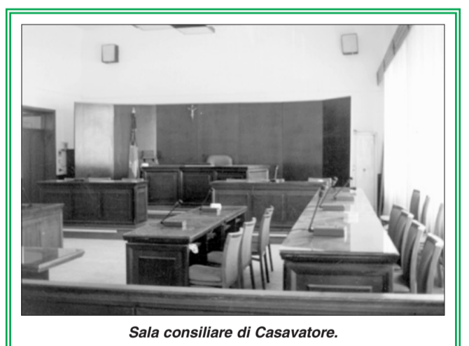
Sala consiliare di Casavatore.

Quello di Casavatore è stato l'unico progetto di gemellaggio della Campania tra i 57 approvati dalla Commissione Europea.