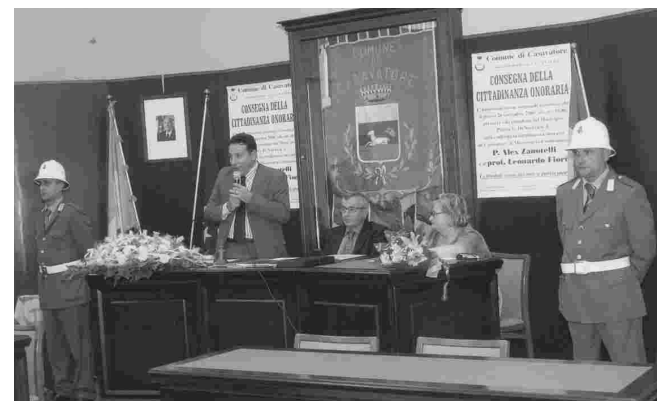
Cittadinanza onoraria: la cerimonia

Ai neo cittadini sono state donate le pergamene riportanti le motivazioni del conferimento e le chiavi in argento della città.